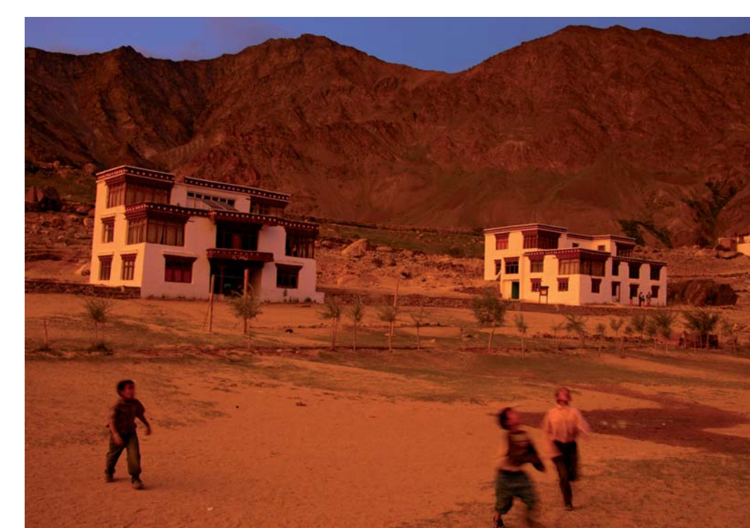
Škola v Raru (Německo)