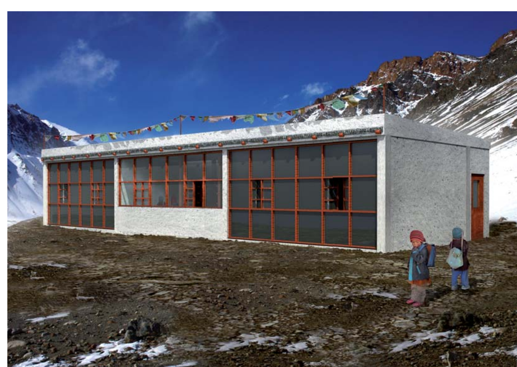
Design využívá technologie Trombeho stěny