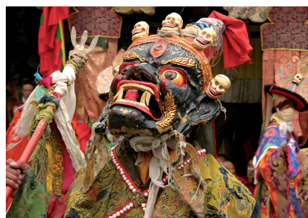
Gonpo – ochránce dharmy