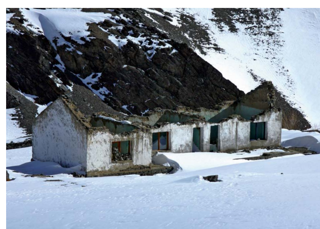
Škola v Testě (Indie)