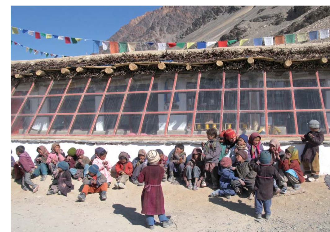
Sluneční škola v Kargyaku (Česká Republika)