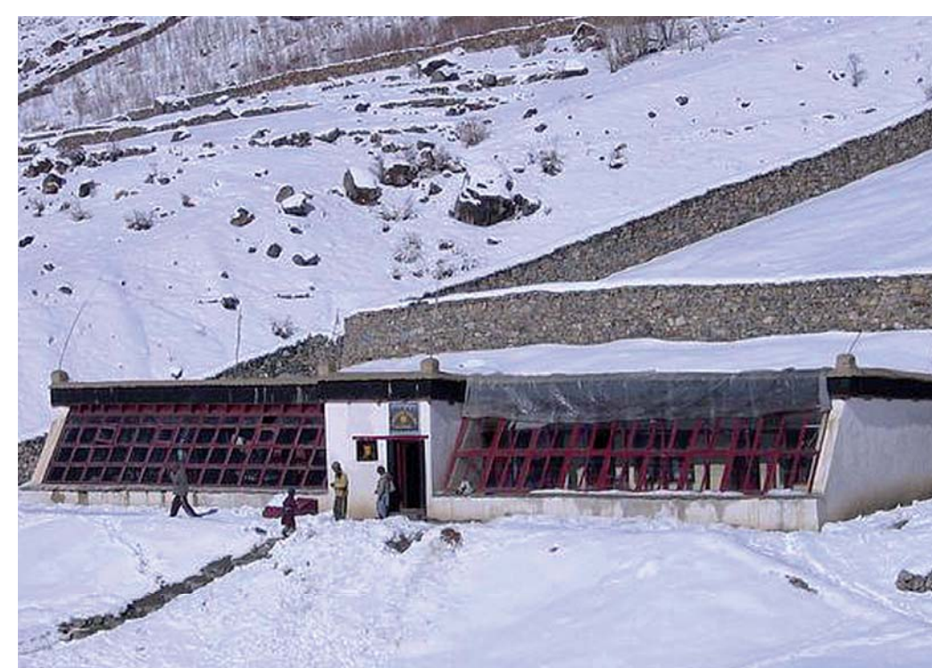
Škola v Lingshedu (Rakousko)