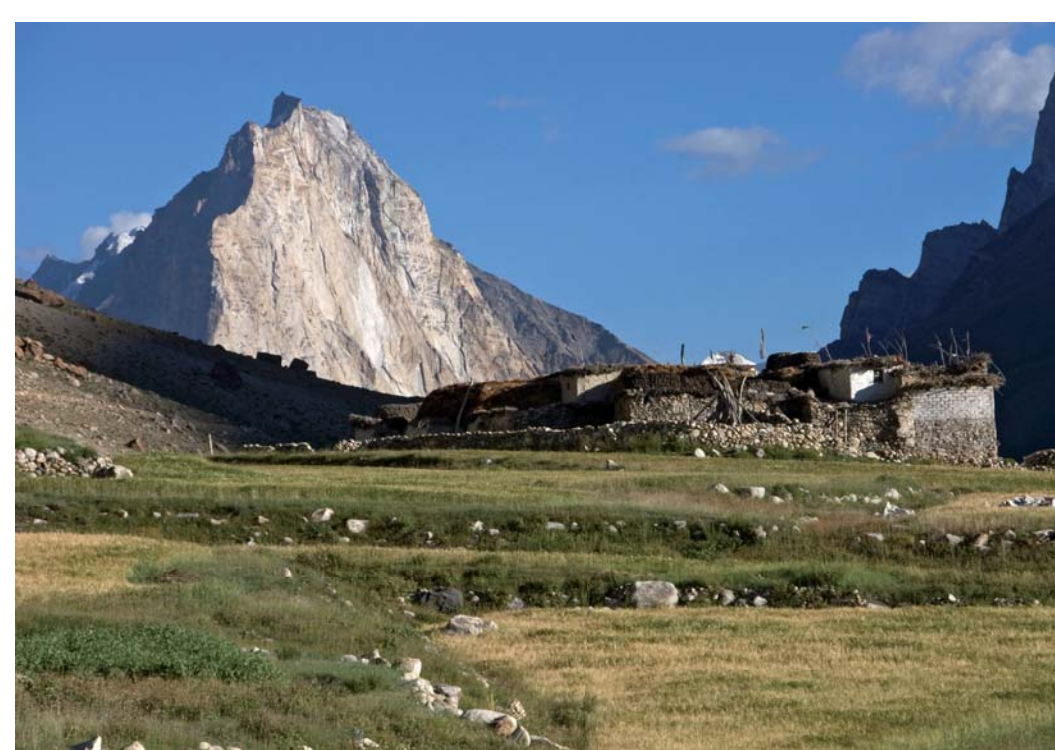
Posvátná hora Gonporangjon

Nad vesnicí, kam zatím silnice nevede, drží ochranou ruku hora Gonporangjon. Gonpo znamená v terminologii tibetského buddhismu ochránce dharmy neboli rádu a místní lidé věří, že se jeho tvář skrývá právě na stěně této hory. Dnes, po několikaletém úsilí si Občanské sdružení BlueLand dovolilo vzít do svých rukou část této odpovědnosti, a to odpovědnost nad těmi nejmenšími. S možnostmi které máme, pomáháme dětem nejen v Kargyaku, ale i v vesnici Ski, Tangso, v klášteře Phuktal a ve správním městečku Padum.