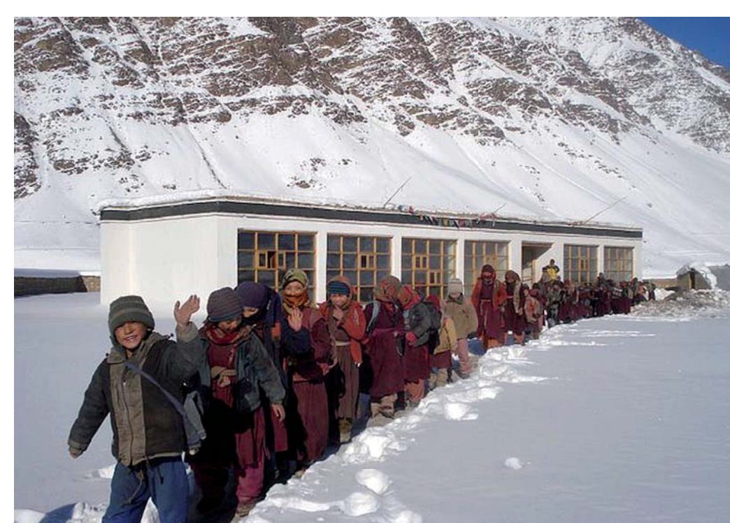
Škola v Sani (Německo)