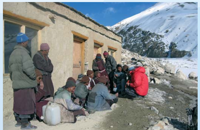
debata nad plány školy