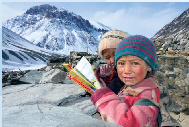
naše prozatím mobilní dětská knihovna v Kargyaku

V souvislosti s podporou tohoto projektu připravujeme na rok 2009 - 2010 putovní výstavu fotografií po městských knihovnách Čech a Moravy. Výstava s názvem „ Jak jsem potkal yaka “ bude slavnostně zahájena v Galerii Divadla Hybernia, v Praze dne 23. 6. 2009 v 18 hodin a potrvá do konce léta 2009.