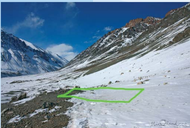
místo pro novou školu

V únoru tohoto roku vybrali členové sdružení BlueLand, spolu s vesnickou radou starších, vhodné místo pro novou školu. Poté O.s. BlueLand dodalo stavební plány a dnes spolupracují s indickou vládou a vesničany na finalizaci projektu. Sdružení BlueLand se pokusí tento projekt finančně podpořit a zajistit odbornou pomoc při samotné realizaci.