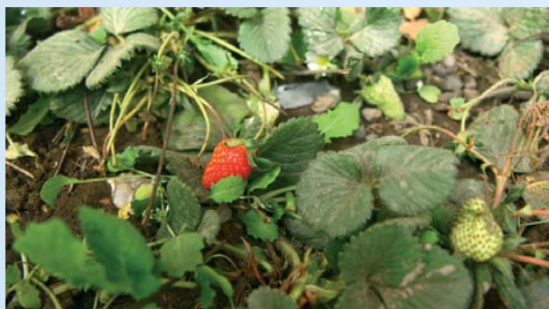
Dolma si oblíbila placky s pažitkou a jahody, které ve skleníku zrají i v zimě