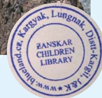
klášter Phuktal v údolí Lung Nak – Zanskar, kde je plánována první knihovna