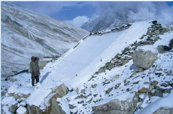
skleník pod sněhem

A hit roku? Letos bude ve výšce 4200 mnm jahodová sezóna.