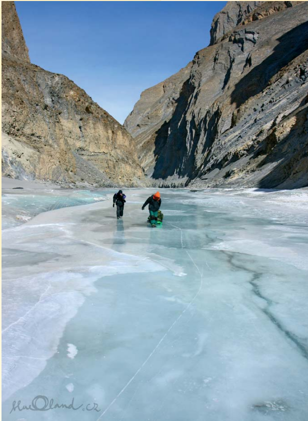
Chadar – cesta po ledu

Nezbylo, než se vydat po zamrzlé řece a věřit, že nám led pod nohama vydrží a v noci bude počasí milosrdné. Běžně tu totiž teploty klesají pod -30\text{ }^{\circ}\text{C} a cestou se nejednou přespává v jeskyni.