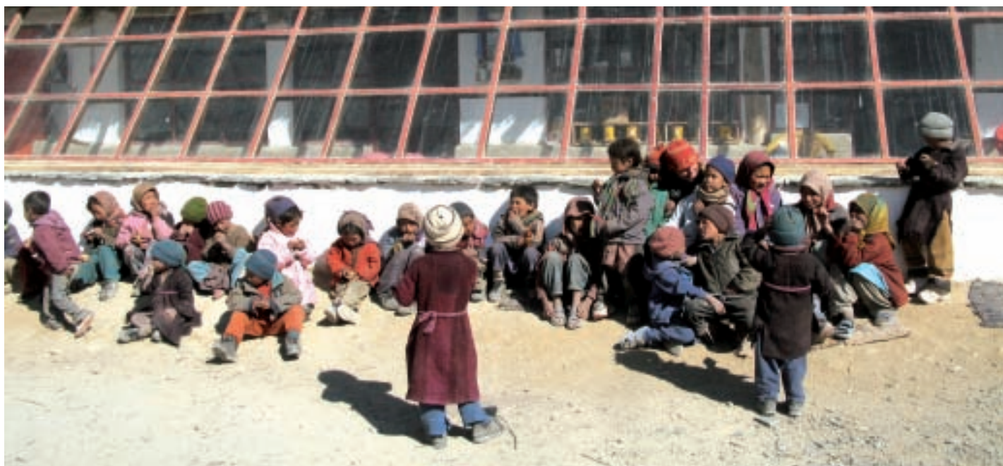
Potřebu vzdělávání dětí si uvědomují i horalé. Škola od Čechů je tak pro ně darem z nebes.

spolufinancuje i projekt výstavby už druhé školy, na jejímž vzniku se Gábina spolu s dalšími dobrovolníky podílí. Úřady daly část peněz na základy a dřevo, dobrovolníci zorganizovali sbírku na fasádu. V červnu se tam nadšenci z Česka chystají odjet a školu dokončit.