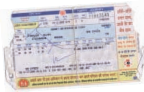
„Když Odzer prodělal třetí operaci, jeli jsme vlakem z Dillí do Goa na sedm týdnů k moři. Odzer vlak zbožňuje, bylo to pro něj dobrodružství,“ říká Gábina.

otevřít všude dveře, a ještě ke všemu jsem z Evropy, toho si považují,“ vypráví Gábina, jak zařizovala pro Odzera léčbu. Během následujících měsíců se za Odzera do Lehu několikrát vrátila a zařídila mu tři plastické operace. Postupně narovnal krček, do podpaždí a lokte dostal kožní štěpy a seškvařené prsty na ruku mu lékaři spravili tak, že dnes je může zase bez problémů používat. Díky Odzerově statečnosti, optimistickému přístupu k životu a Gábinině péči se jeho stav neuvěřitelně zlepšil. „Když jsem po několika měsících přivezla Odzera domů po jedné