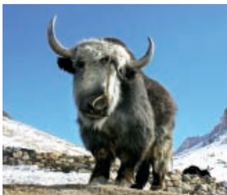
V Himálaji vládne velká chudoba. Pro rodiče jsou často důležitější jaci než jejich děti.

„Jsem zvědavá, co se s místními lidmi do budoucna stane. Je to takový můj soukromý výzkum. Během pár let přes jejich vesnici povede dálnice, která má spojovat celou Indii napříč. Celkem rychle se blíží, už teď je díky ní cesta do naší vesnice o den a půl kratší,“ vysvětluje Gábina důvody, proč se do Himálaje stále vrací. „Já doufám, že